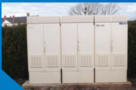
Nouveau répartiteur téléphonique