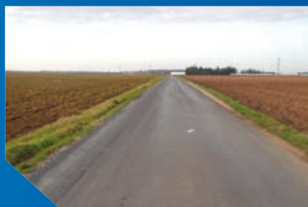
Réaménagements des accotements (ici, rue Verte)