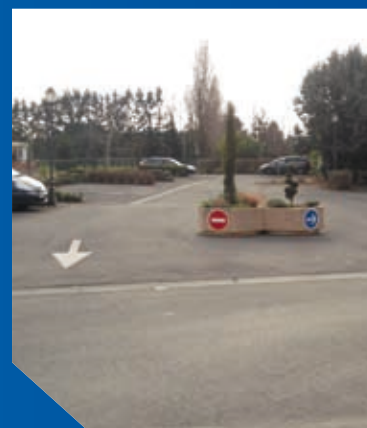
Aménagement du parking de l'école