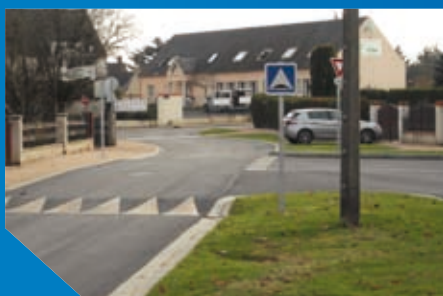
Route de Darvooy