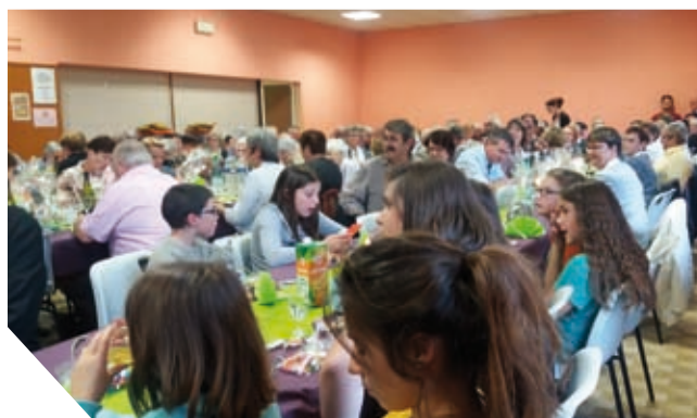
Repas intergénérationnel avec les jeunes d'Artist'ella, le 8 octobre 2016

Un peu avant les fêtes, un colis confectionné par « la sélection du caviste » de Jargeau, a été distribué par les membres du CCAS aux personnes de 70 ans et plus, n'ayant pu assister au repas.