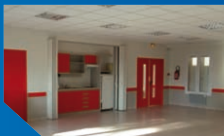
Rénovation à la maison des associations