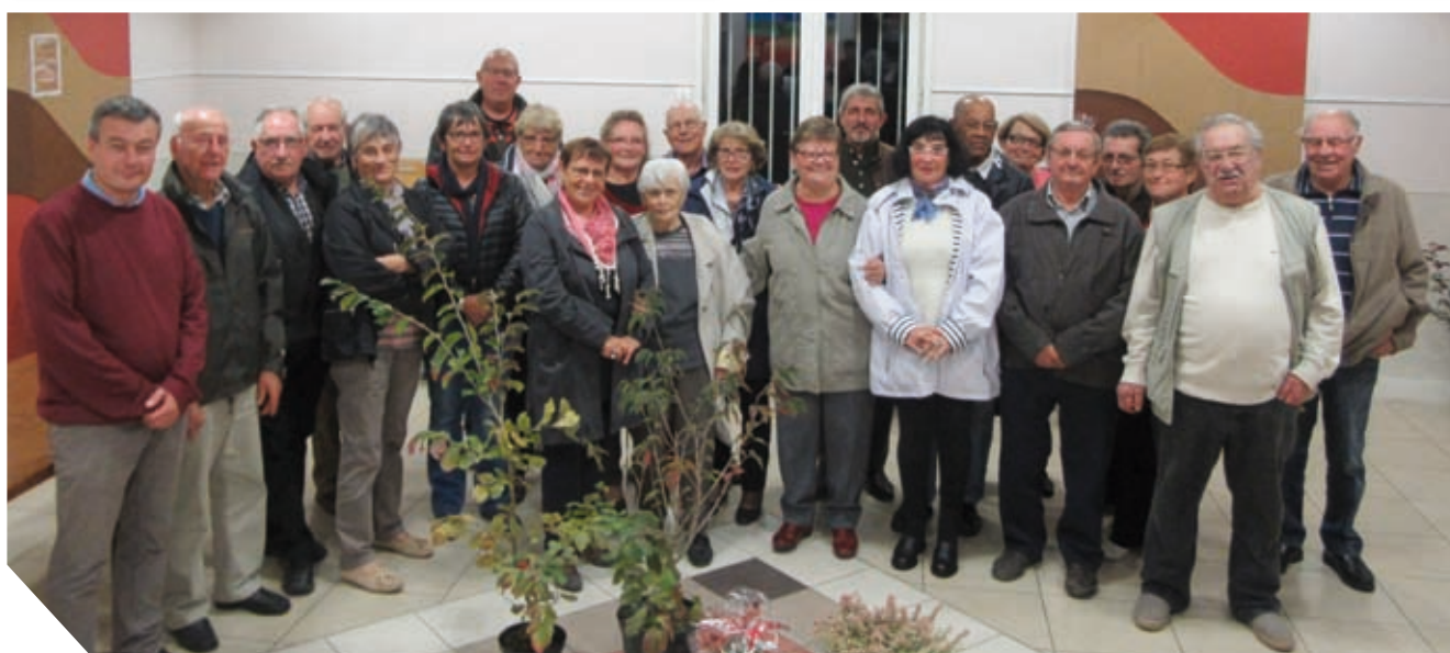
Les lauréats du concours réunis lors de la remise des prix le 14 octobre 2016